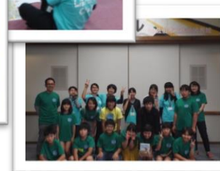
※写真は昨年の様子です